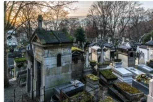
Pere Lachaise Mezarlığı