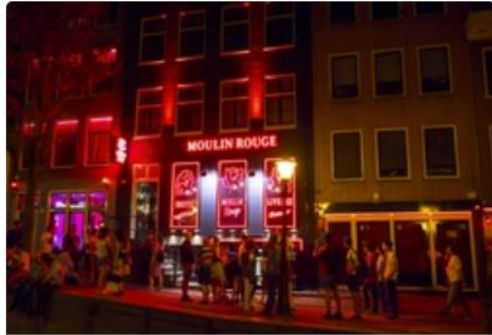
Moulin Rouge Kabaresi