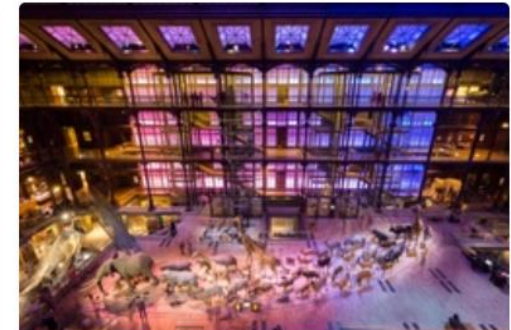
Paris Modern Sanat Müzesi