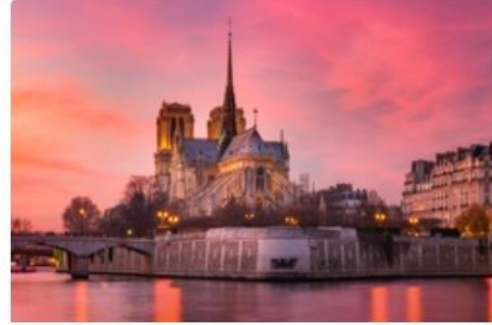
Notre Dame Katedrali